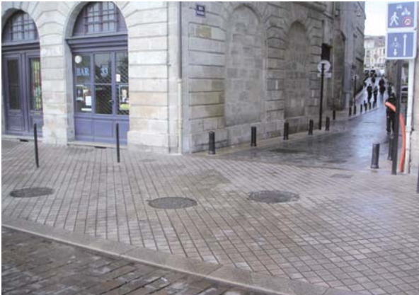
Exemple de trottoir traversant en entrée de zone de rencontre